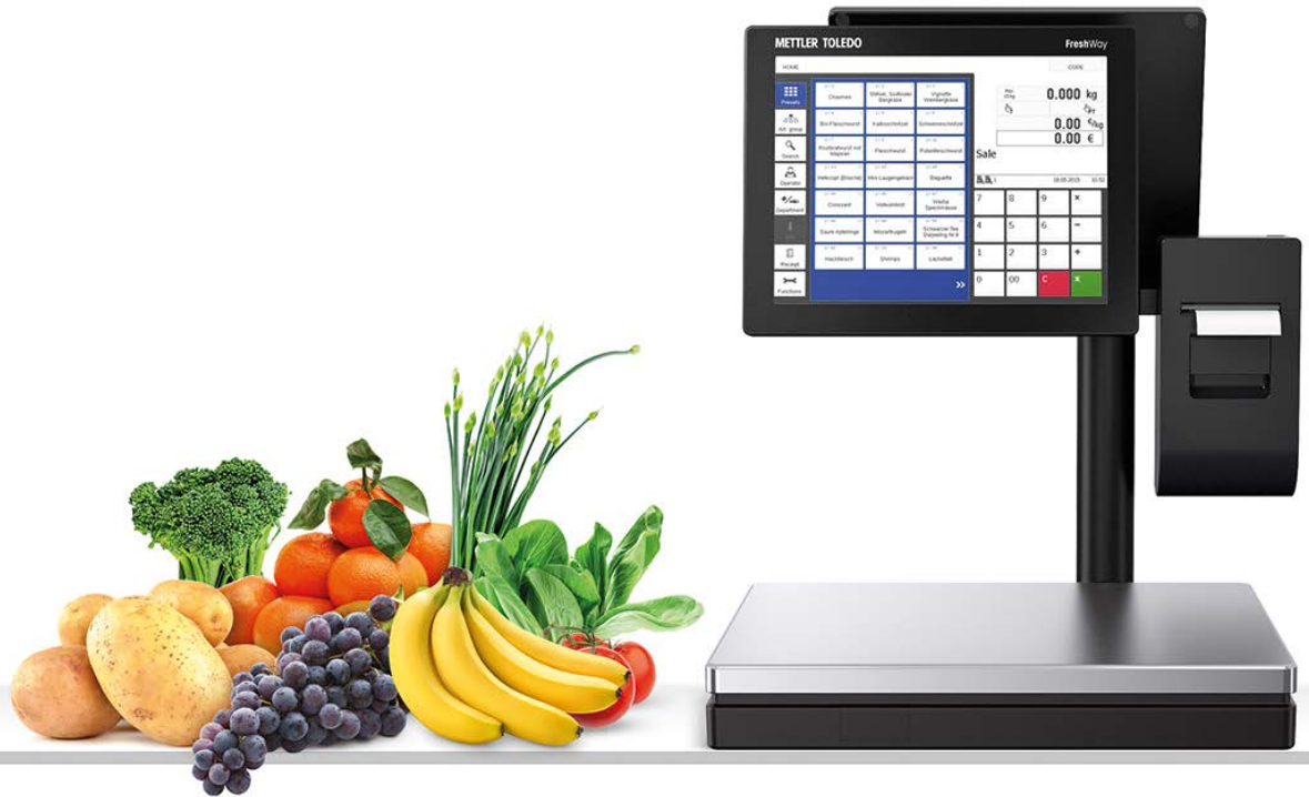
FreshWay avec afficheur sur colonne

FreshWay avec afficheur sur colonne est la nouvelle balance à écran tactile de METTLER TOLEDO. Elle répond aux exigences les plus poussées des commerçants ambitieux. FreshWay T combine un design récompensé avec une performance parfaite et définit de nouvelles normes de pesage et de service au client.